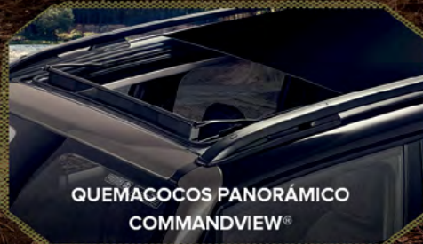
QUEMACOCOS PANORÁMICO COMMANDVIEW®