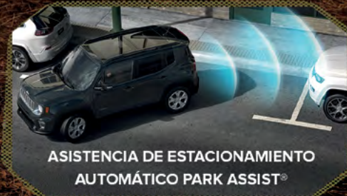
ASISTENCIA DE ESTACIONAMIENTO AUTOMÁTICO PARK ASSIST®