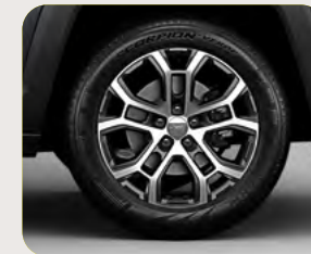
RINES 18" LATITUDE