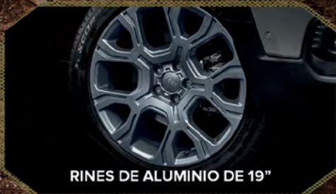
RINES DE ALUMINIO DE 19"