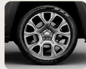
RINES 19" LIMITED